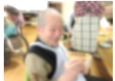
▲「おいしそうですね」とにっこり