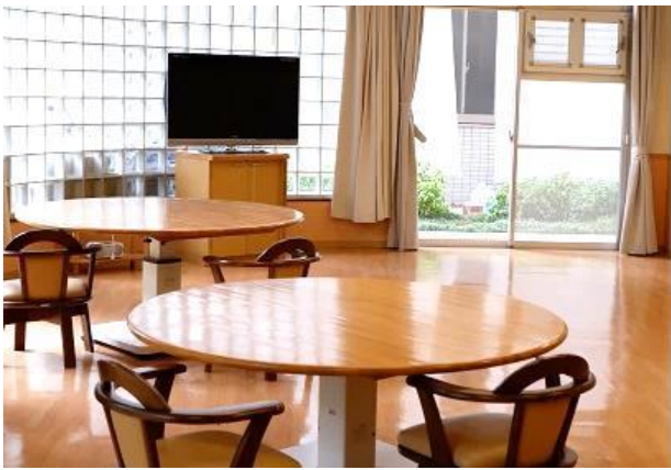
▲ダイニングルーム