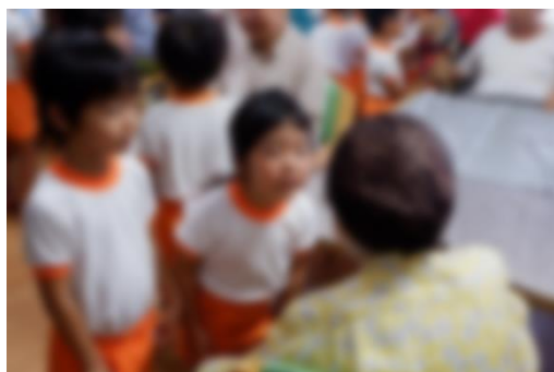
▲大きな声で自己紹介☆ 何歳ですか?と質問。 年齢を聞いてびっくりする園児さん。

※9月は防災月間となっております。その為、9月4日(水)に防災訓練の一環として、昼食に防災食のカレーライス(予定)を召し上がって頂きます。