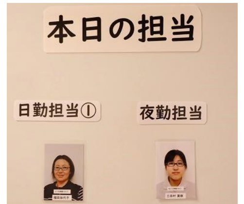
▲担当看護師の紹介