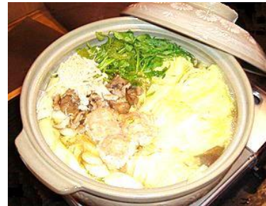
▲蓋を開けると、湯気とともにいい匂いが漂って、食欲をそそります。