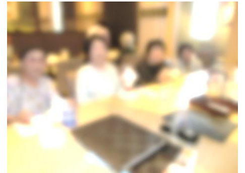
▲「おいしかったわぁ～。」