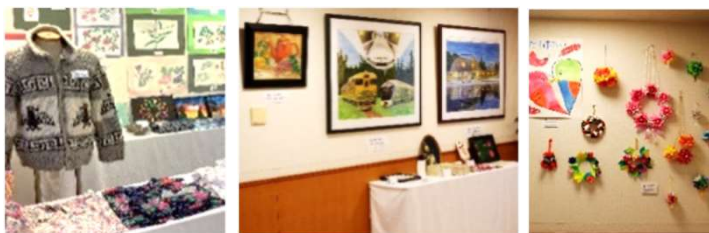
▲昨年の苑内での作品展の様子