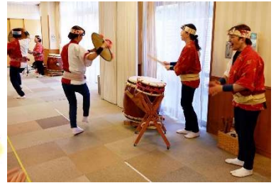
「まつり座」の皆様 の花笠おどりと和太鼓の演奏