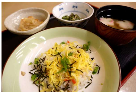
8月10日（金）山の日 山にちなんで山菜ちらし寿司