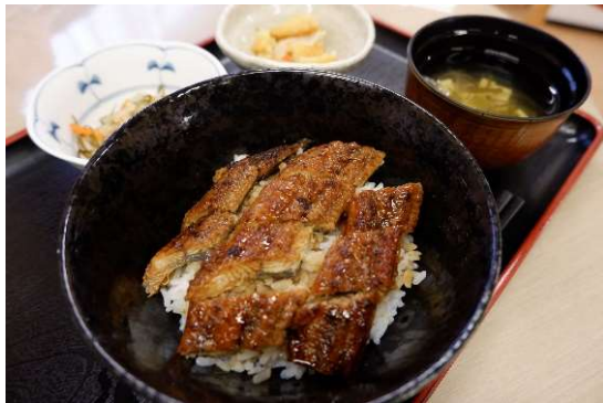
7月30日（日）土用の丑の日 選択メニューの国産うなぎ丼

「幸せを支える栄養」をテーマに、心にも体にも優しい食事のご提供と季節感のある献立作成を行っています。