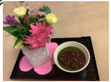
▲管理栄養士手作りの 抹茶水ようかん

9月15日（金）敬老祝賀会を開催いたしました。 今年は17名の入居者様がめでたく賀寿を迎えられました。 昼食は、お赤飯や天ぷら・茶碗蒸し等のお祝い御膳、管理栄養士の 手作りおやつ（抹茶水ようかん）をご用意させていただきました。 皆様「とっても豪華だね。」「美味しそう。｣と、顔をほころばせて いらっしやいました。